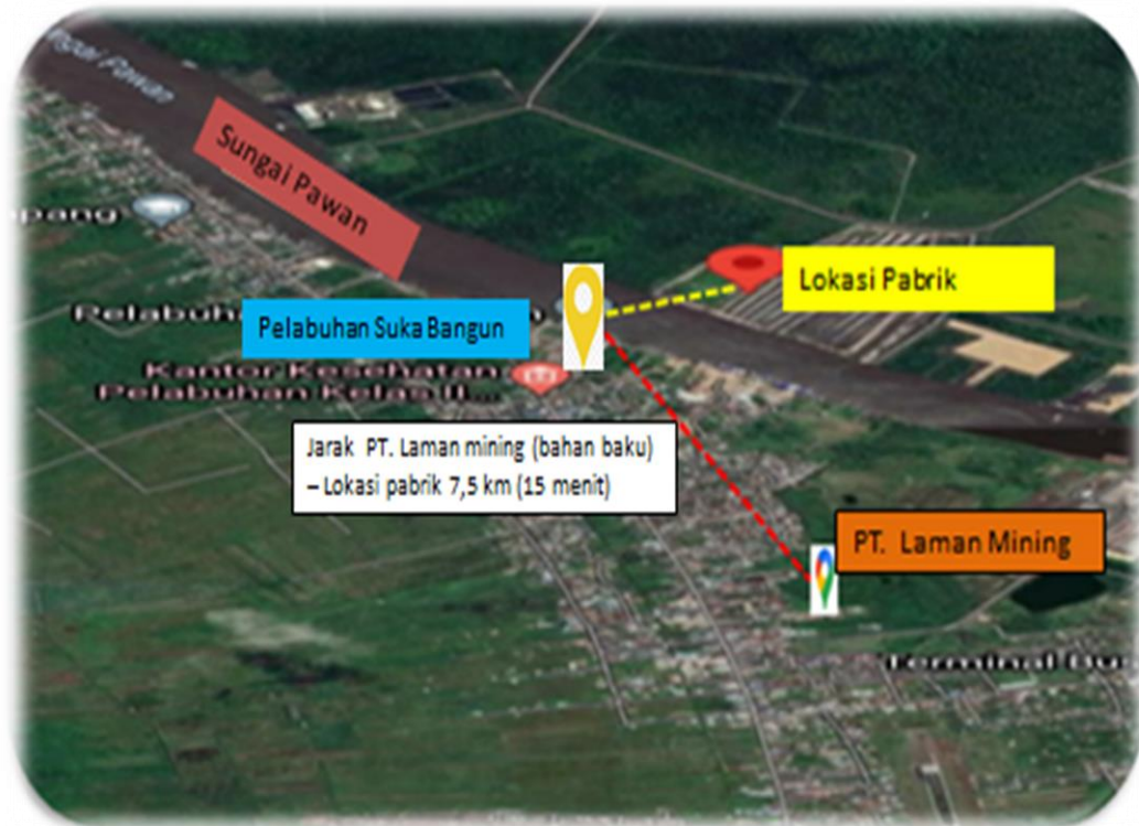
Gambar 1.4 Kawasan industri Ketapang, Kalimantan Barat

Lokasi pabrik terletak di Kawasan industri Ketapang, Kalimantan Barat dapat dilihat pada Gambar 1.4