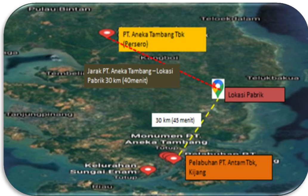
Gambar 1.2 Kijang, Kecamatan Bintang Timur, Kabupaten Bintang, Provinsi Kepulauan Riau

Analisa SWOT untuk pemilihan lokasi alternatif I di Kijang, Kecamatan Bintang Timur, Kabupaten Bintang, Provinsi Kepulauan Riau dapat di lihat pada Tabel 1.5