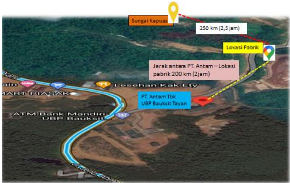
Gambar 1.3 Tayan, Kabupaten Sanggau, Kalimantan Barat

Lokasi pabrik terletak di Tayan, Kabupaten Sanggau, Kalimantan Barat dapat dilihat pada Gambar 1.3