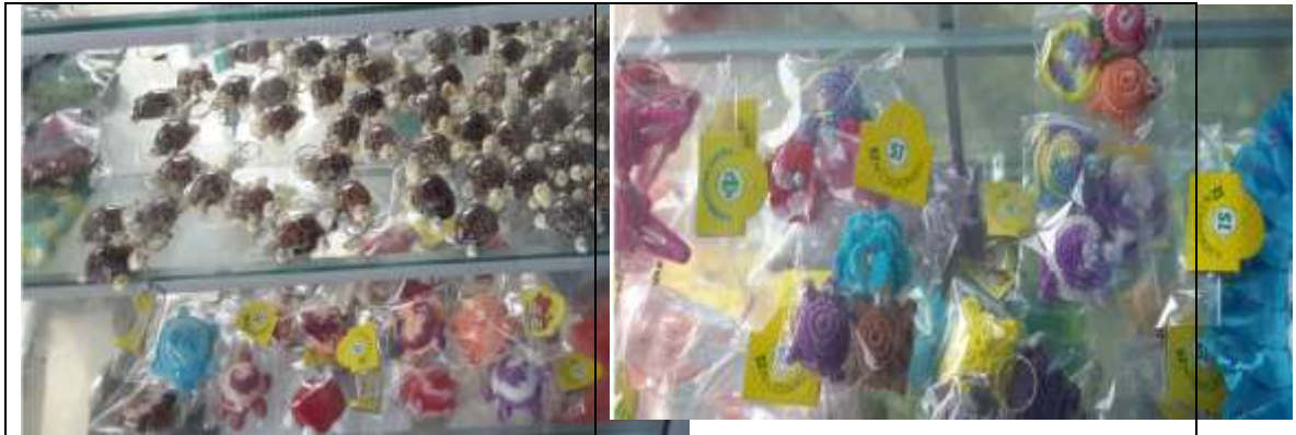
Gambar 4. Cendramata Hasil Pelatihan dari Mahasiswa