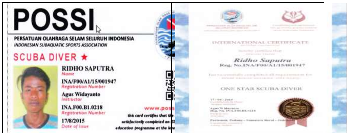
Gambar 3. Kartu anggota Scuba Diver dan Sertifikat

Dipihak lain, dengan bantuan mahasiswa KKN-PPM, maka sudah terbentuk anggaran dasar dan anggaran rumah tangga organisasi selam kota Pariaman yang disebut Tabuik Diving Club (TDC) dan sudah terbentuk struktur organisasi TDC dengan pengurus seperti pada lampiran 4 TDC ini akan diupayakan menjadi organisasi yang berbadan hukum.