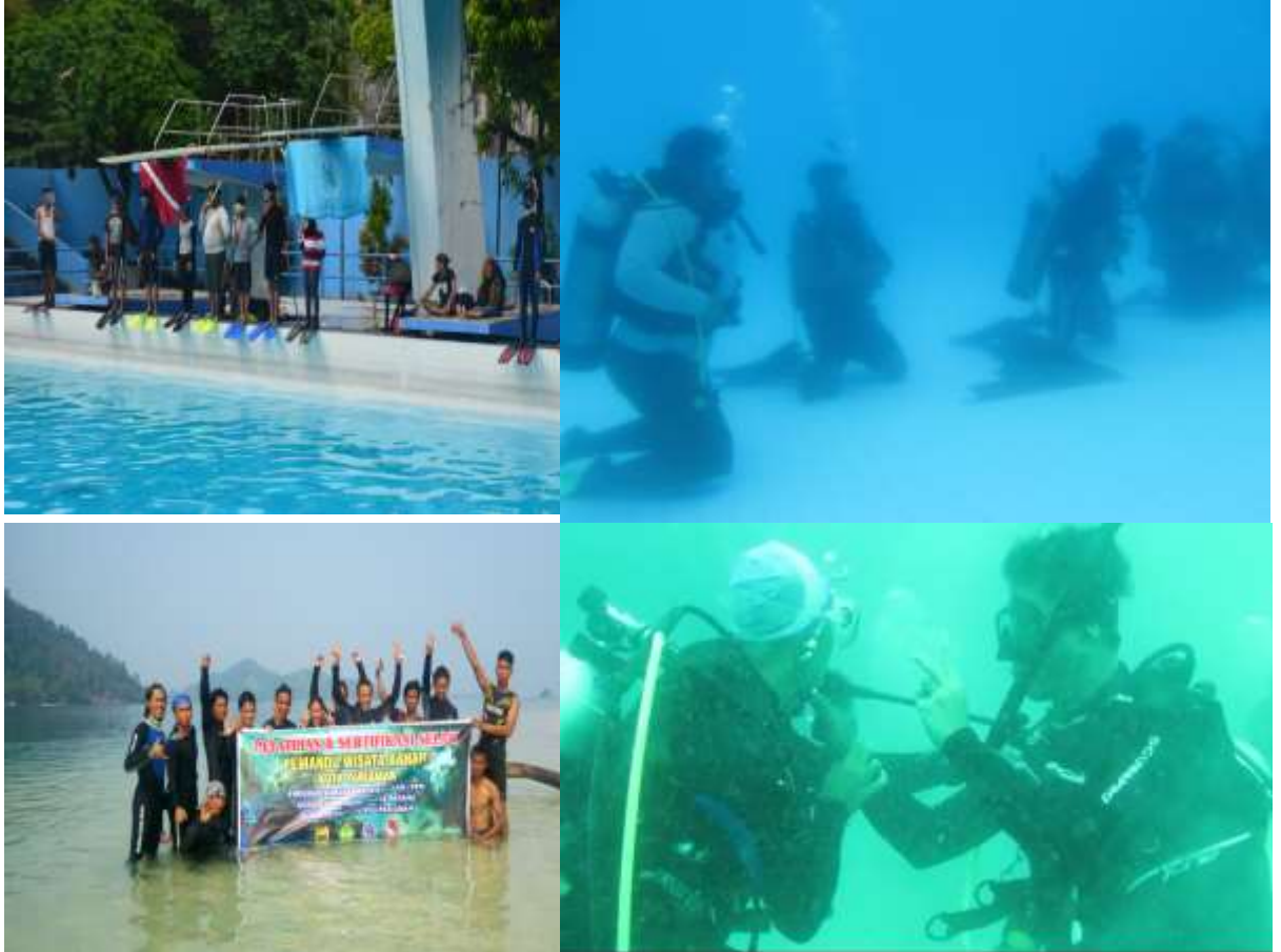
Gambar 2. Kegiatan Pelatihan Selam

Pulau Kasiak dan tanggal 17 Agustus 2015 di pulau Pasumpahan. Kegiatan pelatihan selam terlihat pada gambar 2.