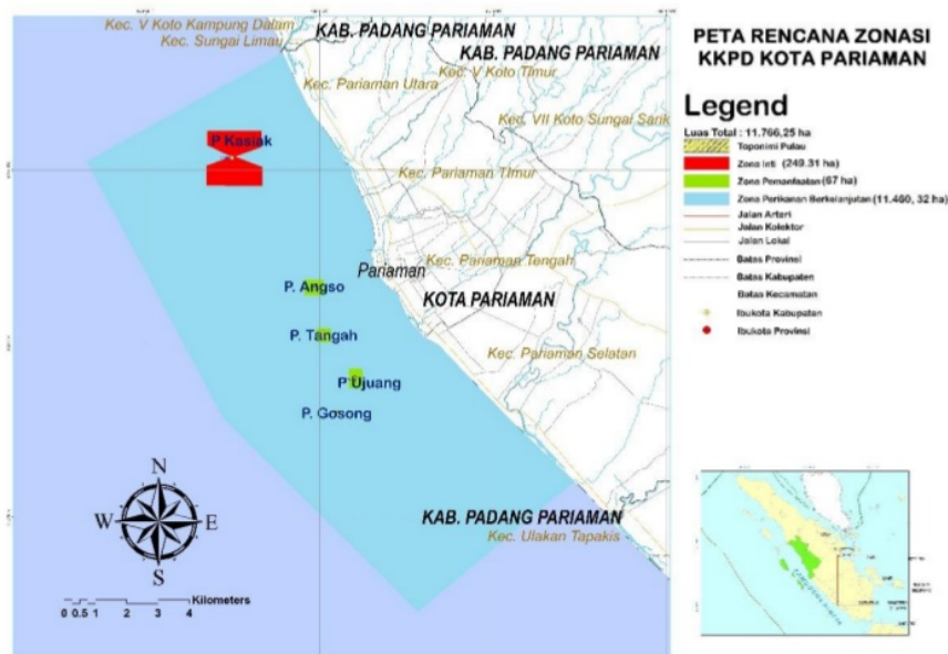
Gambar 1. Peta Rencana Zonasi KKPD Kota Pariaman

Dalam penataan Rencana Zonasi KKPD Kota Pariaman, kawasan yang direncanakan secara garis besar di bagi menjadi 3 zona yaitu zona inti, zona perikanan berkelanjutan dan zona pemanfaatan. Dari luas kawasan total 11.776,63 ha di bagi menjadi 3 zona yaitu zona inti dengan luas 249,31 Ha atau 2,12% dari luas kawasan perencanaan. Zona Perikanan berkelanjutan seluas 11.460,32 ha atau 97,31 % dari luas kawasan perencanaan dan zona pemanfaatan 67,00 ha atau 0,57 % dari luas kawasan perencanaan (Gambar 1 dan Tabel 1).