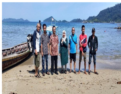
Gambar 3. Survey bersama tokoh pemuda.

Masyarakat yang dilibatkan dalam survey ini adalah masyarakat yang tahu dan mengerti tentang lokasi wisata dan pelaku wisata di Nagari Sungai Pinang (Gambar 3). Masyarakat Sungai Pinang sudah terlibat aktif usaha wisata bahari diantaranya adalah cottage, home stay, boat wisata, penyewaan alat selam dan pemandu wisata. Pendapatan terbesar dari usaha wisata bahari di Sungai Pinang adalah cottage, kemudian diikuti dengan usaha penyewaan alat selam [5].