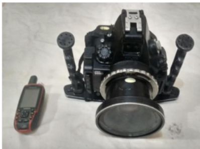
Gambar 2. Kamera Under water dan GPS

Masyarakat yang dilibatkan dalam survey ini adalah masyarakat yang tahu dan mengerti tentang lokasi wisata dan pelaku wisata di Nagari Sungai Pinang (Gambar 3). Masyarakat Sungai Pinang sudah terlibat aktif usaha wisata bahari diantaranya adalah cotage, home stay, boat wisata, penyewaan alat selam dan pemandu wisata. Pendapatan terbesar dari usaha wisata bahari di Sungai Pinang adalah cotage, kemudian diikuti dengan usaha penyewaan alat selam [5].