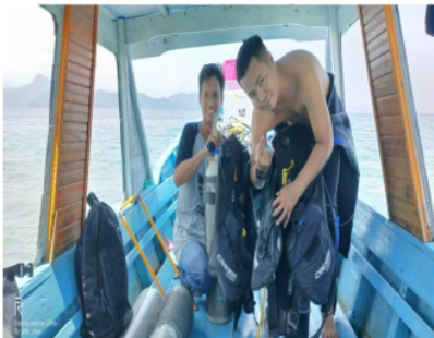
Gambar 1. Persiapan peralatan selam

Peralatan survey laut yang digunakan adalah alat selam, kamera under water, GPS dan boat. Alat selam dan kamera under water digunakan untuk melihat kondisi karang dan jenis karang. Untuk wisata diving dan snorkling membutuhkan kondisi karang dan ikan karang yang baik. GPS berguna untuk menentukan posisi titik koordinat obyek wisata (Gambar 1 dan Gambar 2).