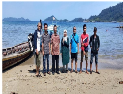
Gambar 3. Survey bersama tokoh pemuda.

Masyarakat yang dilibatkan dalam survey ini adalah masyarakat yang tahu dan mengerti tentang lokasi wisata dan pelaku wisata di Nagari Sungai Pinang (Gambar 3). Masyarakat Sungai Pinang sudah terlibat aktif usaha wisata bahari diantaranya adalah cotage, home stay, boat wisata, penyewaan alat selam dan pemandu wisata. Pendapatan terbesar dari usaha wisata bahari di Sungai Pinang adalah cotage, kemudian diikuti dengan usaha penyewaan alat selam [5].