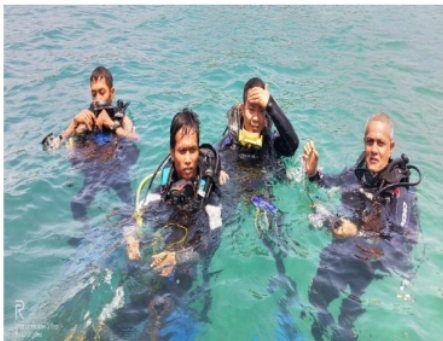
Gambar 4. Survey terumbu karang