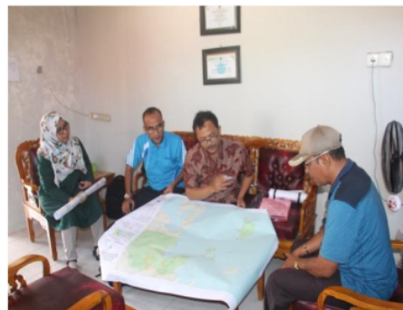
Gambar 6. Diskusi peta dengan tokoh pemuda dan Wali Nagari