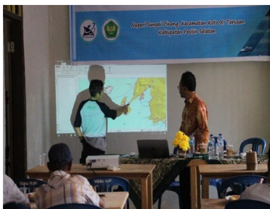
Gambar 6. Diskusi peta dengan tokoh pemuda dan Wali Nagari