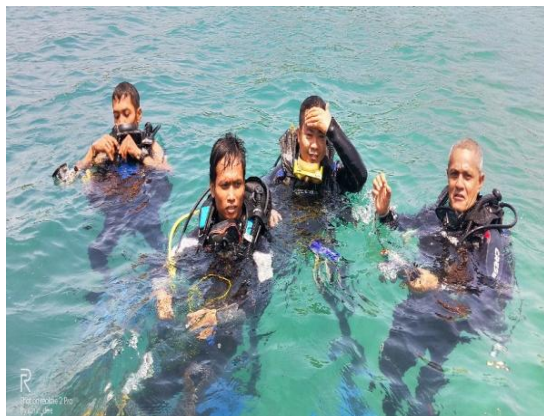
Gambar 4. Survey terumbu karang