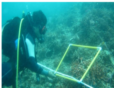
Gambar 5. Kondisi terumbu karang