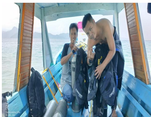
Gambar 1. Persiapan peralatan selam

Peralatan survey laut yang digunakan adalah alat selam, kamera under water, GPS dan boat. Alat selam dan kamera under water digunakan untuk melihat kondisi karang dan jenis karang. Untuk wisata diving dan snorkling membutuhkan kondisi karang dan ikan karang yang baik. GPS berguna untuk menentukan posisi titik koordinat obyek wisata (Gambar 1 dan Gambar 2).