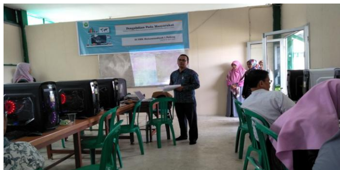
Gambar 3. Penyajian Materi