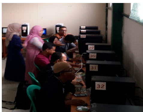
Gambar 4. Pendampiangn Pembuatan Multimedia Pembelajaran