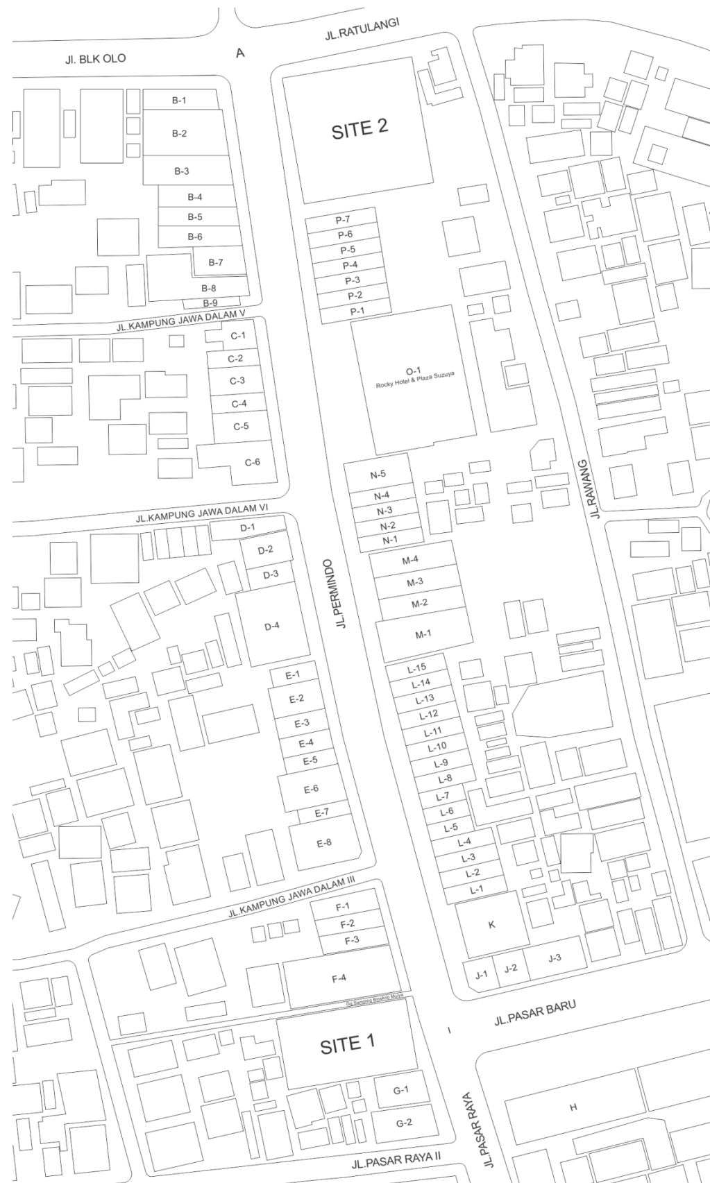
Gambar I.4 : Peta Citra Kawasan Permindu