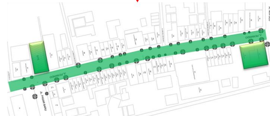
Gambar I.3 : Peta Citra 2013