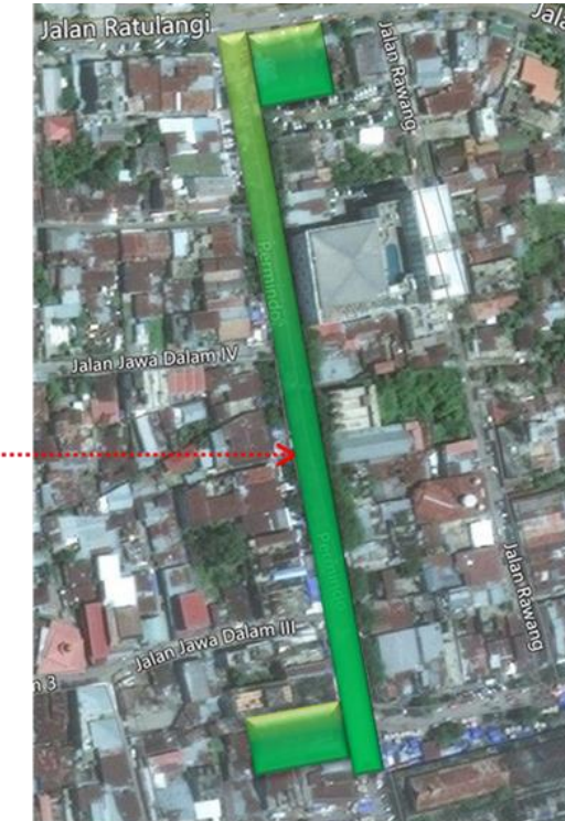
Gambar I.2 : Kawasan Permindo