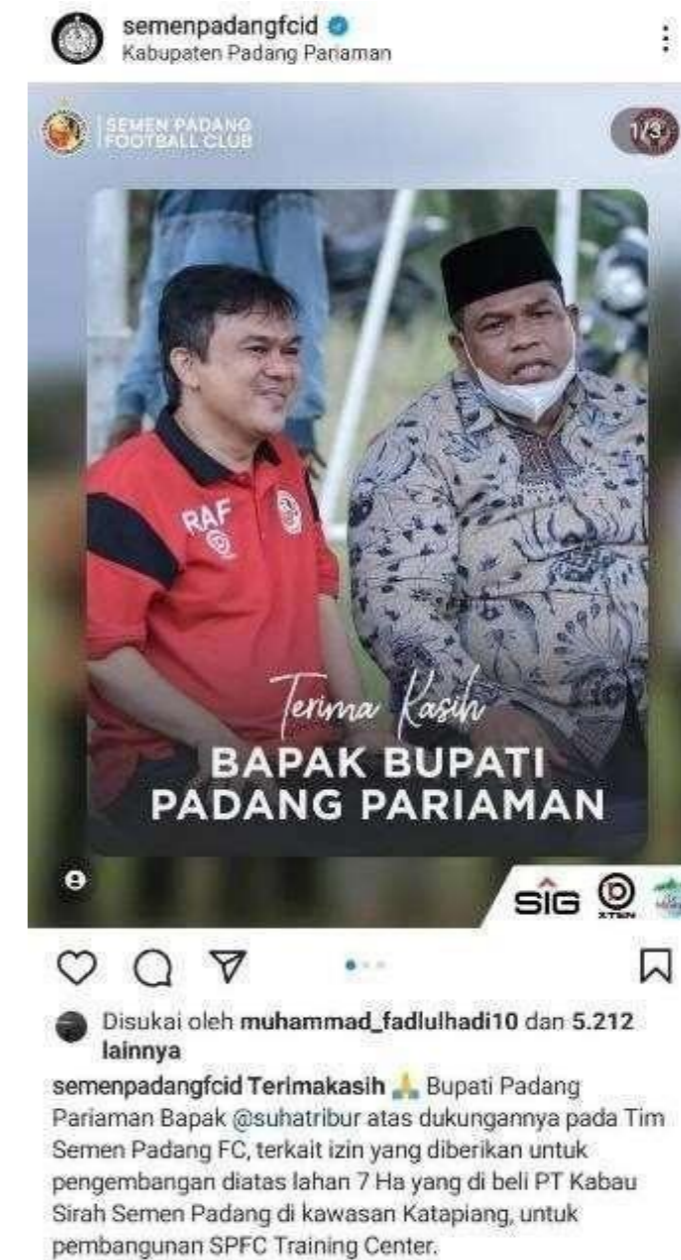
Gambar 1.3 Postingan Semen Padang FC

Semen Padang FC sebenarnya sudah memiliki fasilitas klub yang terletak di Kawasan PT Semen Padang seperti lapangan latihan, mess pemain, gym, dan kantor, namun fasilitas ini terbilang masih belum berstandar FIFA, namun dari sumber berita dan akun resmi instagram Semen Padang FC, seperti gambar di bawah, Semen Padang FC sudah mendapat izin dari bupati Padang Pariaman yakni bapak Suhatri Bur. Terkait izin untuk mengembangkan pembangunan SPFC Training canter , diatas lahan 7 hektar, yang dibeli PT Kabau Sirah SemenPadang di Kawasan katapiang.