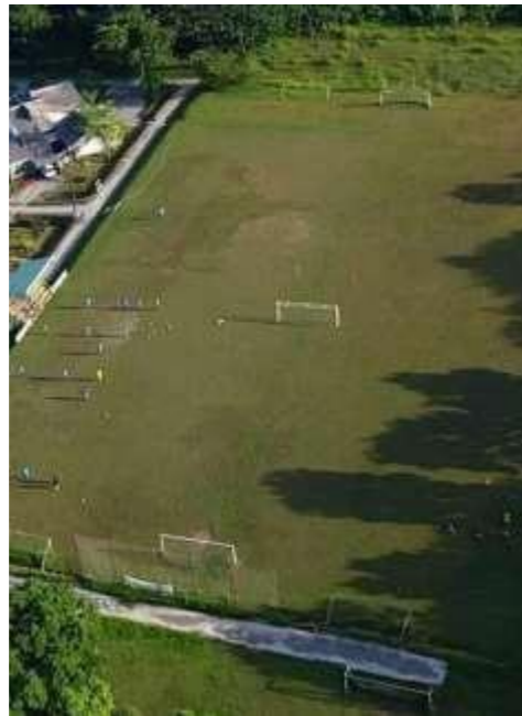
Gambar 1.2 lapangan latihan Semen Padang FC