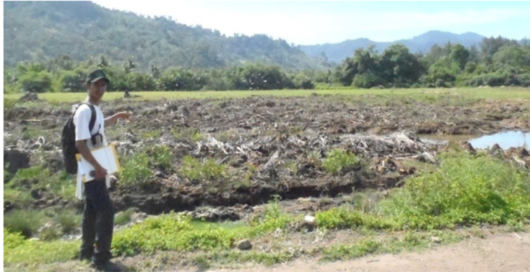
Gambar 3. Pembukaan lahan pada zona lindung di Labuhan Tarok.

Lokasi 2 (Cindakir) merupakan habitat tumbuhan ekosistem mangrove berpantai berbatu/tebing ( cliff rock ) (Gambar 2). Pantai Cindakir merupakan hilir sungai batang Cindakir yang mana hulunya berupa air terjun yang secara umum pada lokasi tersebut berupa batu - batu besar. Adapun sedimen pada pantai Cindakir berupa kerakal yang cukup besar, sehingga tidak terbawa oleh aliran air. Pada pantai Cindakir juga ditemukan lamun ( seagrass ) jenis Thalasia sp. , akan tetapi vegetasi lamun umumnya tertutup oleh sedimen. Adapun sedimen yang terlihat tersebut kemungkinan berasal dari bawaan air larian dari sungai batang Cindakir. Tumbuhan ekosistem mangrove sedjati yang ditemukan yaitu famili Primulaceae seperti Aegiceras corniculatum sp. dan Aegiceras floridum sp. , famili Rhizophoraceae seperti Rhizophora mucronata sp. , Ceriops tagal sp. , dan Bruguiera hainessi sp. , famili Sonneratiaceae seperti Sonneratia alba sp. dan famili Arecaceae seperti Nypa fruticans sp. Jenis tumbuhan ekosistem mangrove ikutan yang ditemukan yaitu famili Malvaceae seperti Thespesia populnea sp. dan famili Pandanaceae seperti Pandanus odoratissima sp.