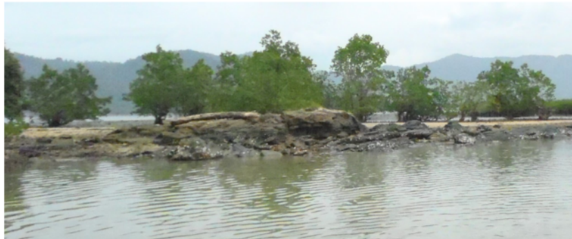
Gambar 4. Tumbuhan ekosistem mangrove pada zona lindung di Cindakir.

Lokasi 2 (Cindakir) merupakan habitat tumbuhan ekosistem mangrove berpantai berbatu/tebing ( cliff rock ) (Gambar 2). Pantai Cindakir merupakan hilir sungai batang Cindakir yang mana hulunya berupa air terjun yang secara umum pada lokasi tersebut berupa batu - batu besar. Adapun sedimen pada pantai Cindakir berupa kerakal yang cukup besar, sehingga tidak terbawa oleh aliran air. Pada pantai Cindakir juga ditemukan lamun ( seagrass ) jenis Thalasia sp. , akan tetapi vegetasi lamun umumnya tertutup oleh sedimen. Adapun sedimen yang terlihat tersebut kemungkinan berasal dari bawaan air larian dari sungai batang Cindakir. Tumbuhan ekosistem mangrove sedjati yang ditemukan yaitu famili Primulaceae seperti Aegiceras corniculatum sp. dan Aegiceras floridum sp. , famili Rhizophoraceae seperti Rhizophora mucronata sp. , Ceriops tagal sp. , dan Bruguiera hainessi sp. , famili Sonneratiaceae seperti Sonneratia alba sp. dan famili Arecaceae seperti Nypa fruticans sp. Jenis tumbuhan ekosistem mangrove ikutan yang ditemukan yaitu famili Malvaceae seperti Thespesia populnea sp. dan famili Pandanaceae seperti Pandanus odoratissima sp.