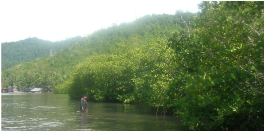
Gambar 5. Tumbuhan ekosistem mangrove pada zona lindung di Teluk Kabung.

di Teluk Buo, serta sering dijadikan sebagai tempat strategis bagi nelayan sebagai lokasi fishing ground benih karena lokasi ini merupakan spawning area dan nursery area yang terlindung dari pengaruh aliran muara sungai yang berlumpur (Gambar 5). Jenis tumbuhan ekosistem mangrove sedjati yang ditemukan yaitu famili Rhizophoraceae seperti Rhizophora mucronata sp. , Ceriops tagal sp. , Ceriops decandra sp. , dan Bruguiera hainessi sp. , famili Sonneratiaceae seperti Sonneratia alba sp. , serta famili Rubiaceae seperti Scyphiphora hydrophillacea sp. , dan tidak ditemukan jenis mangrove ikutan.