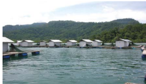
Gambar 1. Contoh Budidaya Pantai yang Dikembangkan di Kawasan Carocok, Kabupaten Pesisir Selatan

dan efisien jika teknologi yang digunakan dapat melakukan penangkapan dengan hasil yang optimal tetapi dengan biaya yang minimal. Syarat ini bisa terpenuhi jika teknologi yang digunakan mempunyai ketepatan yang tinggi. Mulai dari ketepatan dalam menentukan daerah penangkapan ikan ( fishing ground ) sampai ketepatan alat tangkap yang akan digunakan.