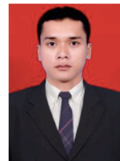
I Made Sarmita