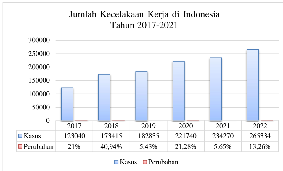
Gambar 1.1 Jumlah Kecelakaan Kerja di Indonesia Tahun 2017-2021

Badan Penyelenggara Jaminan Sosial (BPJS) Ketenagakerjaan mencatat, jumlah kecelakaan kerja di Indonesia sebanyak 265.334 kasus pada 2022. Jumlah tersebut naik 13,26% dari tahun sebelumnya yang sebesar 234.270 kasus. Berikut akan disajikan jumlah kecelakaan kerja di Indonesia dari tahun 2017-2022, sebagai berikut: