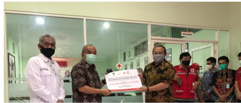
Gambar 1.2 Pakar Kejiwaan UGM Jelaskan Mengapa Wanita Rentan Stres

Liputan/Berita 8 Mei 2020, 10.30 Oleh : Administrator