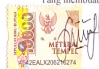
Faisal Al Rasyid