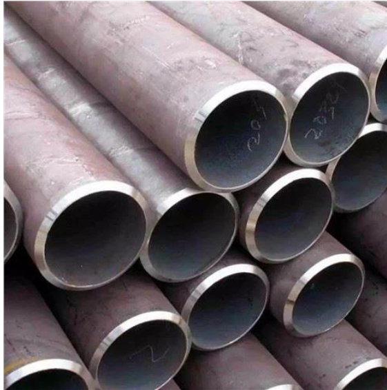
Gambar 1.1 Sampel pipa distribusi crude oil

sampel pipa distribusi crude oil dari Tangki penampungan menuju heat exchanger yang didapat kan dari PT.Pertamina RU.II Production Sungai Pakning.