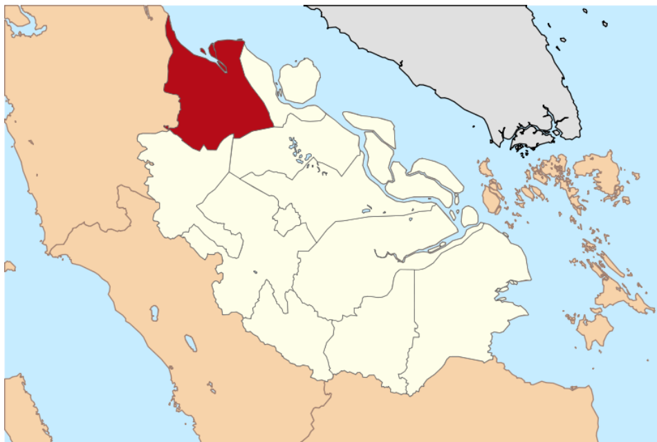
Gambar 1.2 Peta Daerah Rokan Hilir

Pemilihan lokasi pendirian pembuatan pulp ini direncanakan di Rokan Hilir. Beragamnya lokasi yang akan dipilih tersebut membuat pemilihan lokasi dilakukan dengan analisa SWOT ( Strength, Weakness, Opportunities dan Threat ). Peta daerah Rokan Hilir dapat dilihat pada Gambar 1.2