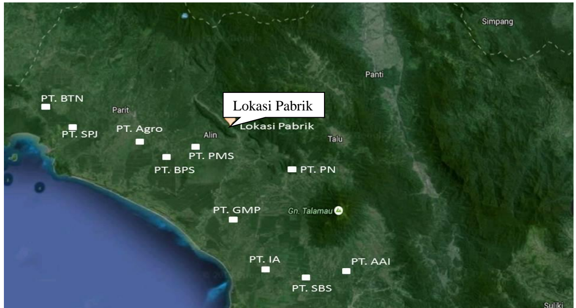
Gambar 1.2 Peta Kabupaten Pasaman Barat

Berdasarkan tabel 1.5 maka Pra rancangan pabrik ini direncanakan akan didirikan di Kabupaten Pasaman Barat, Provinsi Sumatera Barat yang terlihat pada Gambar 1.2. Dasar pertimbangan dalam pemilihan lokasi ini adalah :