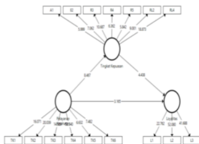
Gambar 2 Model Struktural

Hipotesis dijawab dengan menggunakan path coefficient dan nilai t-statistik. Dimana hipotesis diterima jika nilai t lebih besar dari 1,96 ( \alpha = 1\% ) dan arah positif dan dikatakan signifikan jika nilai p-value kecil dari 0,05%. Dalam penelitian ketiga hipotesis diterima dan signifikan, karena nilai t lebih besar dari 1,96