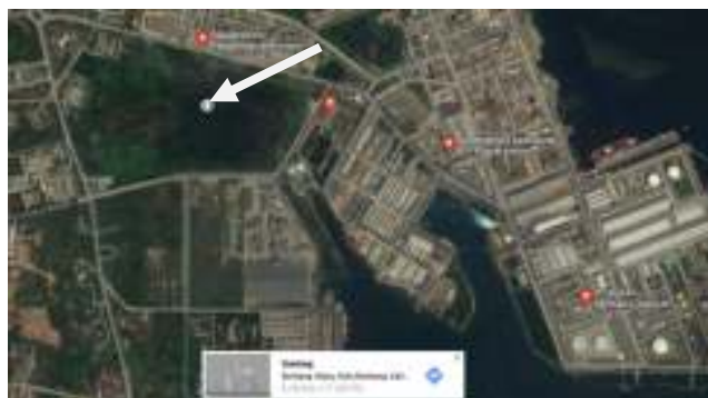
Gambar 1.4 Peta Lokasi Pabrik di Guntung, Bontang utara, Kalimantan Timur