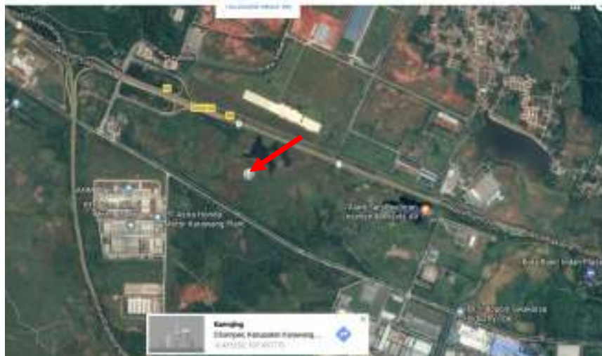
Gambar 1.3 Peta Lokasi Pabrik di Cikampek, Karawang, Jawa Barat

Analisa SWOT ( Strength, Weakness, Opportunities dan Threat ) di Cikampek, Karawang, Jawa Barat.