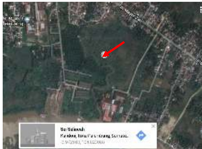
Gambar 1.2 Peta Lokasi Pabrik di Kalidoni, Palembang, Sumatera selatan

Analisa SWOT ( Strength, Weakness, Opportunities dan Threat ) di Kalidoni, Palembang, Sumatera Selatan.