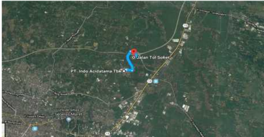
Gambar 1.4 Lokasi Pabrik Asetanilida di Kabupaten Karanganyar

Kabupaten ini berbatasan dengan Kabupaten Sragen di utara, Kabupaten Ngawi dan Kabupaten Magetan (Jawa Timur) di timur, Kabupaten Wonogiri di selatan, serta Kabupaten Boyolali, Kota Surakarta, dan Kabupaten Sukoharjo di barat