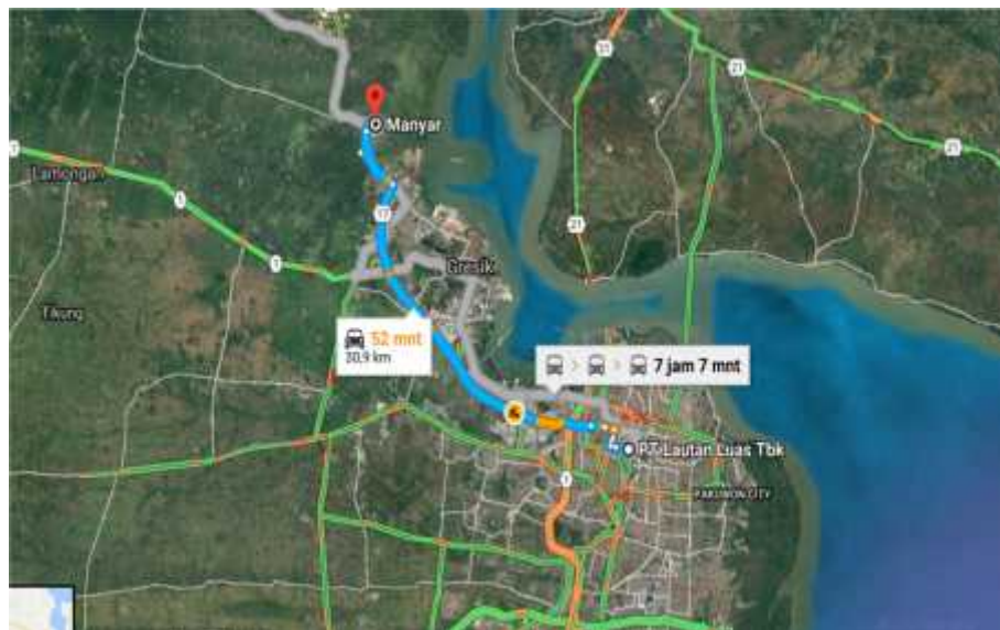
Gambar 1.3 Lokasi Pabrik Asetanilida di Kabupaten Gresik

Lokasi Kabupaten Gresik terletak di sebelah barat laut Kota Surabaya, ibu kota Provinsi Jawa Timur. Pusat pemerintahan Kabupaten Gresik yaitu Kecamatan Gresik berada 20 km sebelah utara Kota Surabaya. Kabupaten Gresik terbagi dalam 18 kecamatan dan terdiri dari 330 desa dan 26 kelurahan. Secara geografis, wilayah Kabupaten Gresik terletak antara 112^{\circ} sampai 113^{\circ} Bujur Timur dan 7^{\circ} sampai 8^{\circ} Lintang Selatan dan merupakan dataran rendah dengan ketinggian 2 sampai 12 meter di atas permukaan air laut, kecuali Kecamatan Panceng yang mempunyai ketinggian 25 meter di atas permukaan laut. Sebagian wilayah Kabupaten Gresik merupakan daerah pesisir pantai, yaitu memanjang mulai dari Kecamatan Kebomas, Gresik, Manyar, Bungah, Sidayu, Ujungpangkah dan Panceng serta Kecamatan Sangkapura dan Tambak yang lokasinya berada di Pulau Bawean. Jenis tanah di wilayah Kabupaten Gresik sebagian besar merupakan tanah kapur yang relatif tandus.