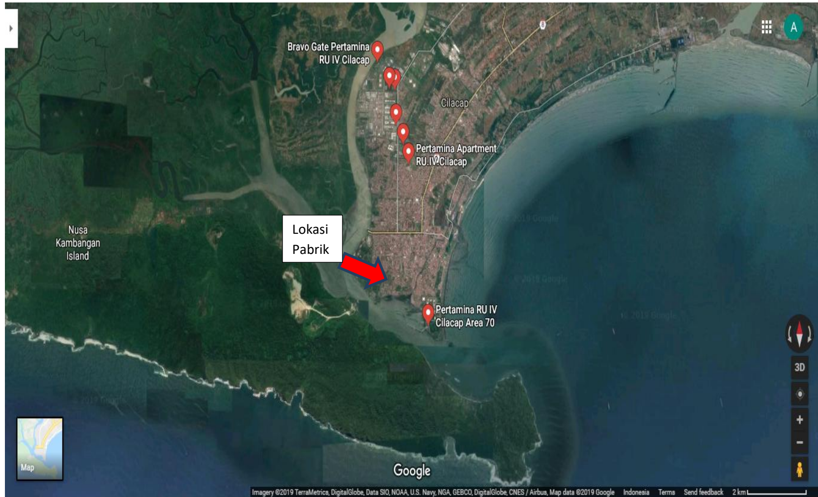
Gambar 1.2 Lokasi Pendirian Pabrik di Cilacap, Jawa Tengah