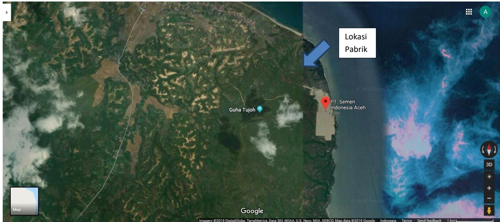
Gambar 1.3 Lokasi Pendirian Pabrik di Aceh

Untuk lebih jelasnya gambar tentang lokasi pendirian pabrik di Aceh dapat dilihat pada Gambar 1.3