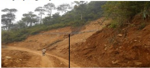
Kemiringan lereng yang tajam

Perubahan iklim global yang terjadi belakangan ini ternyata berdampak pada terjadinya akumulasi curah hujan tinggi dalam waktu yang singkat. Dengan curah hujan tahunan yang relatif sama, namun dengan durasi yang singkat akan berdampak pada meningkatnya intensitas banjir yang terjadi.