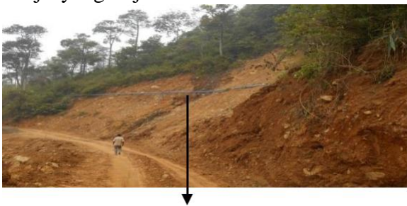
Kemiringan lereng yang tajam

Perubahan iklim global yang terjadi belakangan ini ternyata berdampak pada terjadinya akumulasi curah hujan tinggi dalam waktu yang singkat. Dengan curah hujan tahunan yang relatif sama, namun dengan durasi yang singkat akan berdampak pada meningkatnya intensitas banjir yang terjadi.