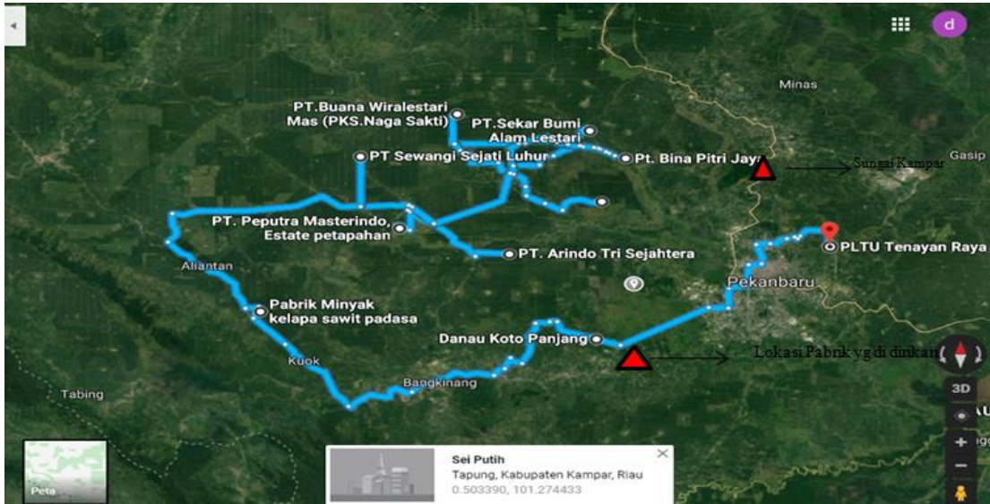
Gambar 1.2 Lokasi pabrik di Kampar, Riau

Kampar, merupakan salah satu kabupaten di provinsi Riau. Kabupaten ini terletak pada posisi kordinat 01^{\circ} 00'40'' LU sampai 00^{\circ}27;00'' LS dan 100^{\circ} 28'30'' BT dengan batas sebelah utara kota pekanbaru dan rokan hilir sebelah selatan berbatasan dengan kabupaten kuantan singgigi sebelah timur kabupaten Pelalawandan Kab. Siak dan sebelah barat berbatasan dengan rokan hulu dan Provinsi Sumatar Barat. Luas total wilayah Kabupaten Kampar adalah 10.983,46 km 2 Kabupaten Kampar dibagi menjadi 20 wilayah kecamatan dan 206 desa/kelurahan dengan jumlah penduduk mencapai 626.286 jiwa kondisi cuaca beriklim tropis dengan temperature rata-rata 26 – 33 °C. Kabupaten Kampar merupakan salah satu wilayah yang memiliki potensi yang cukup prospektif, khususnya di pengolahan minyak kelapa sawit.