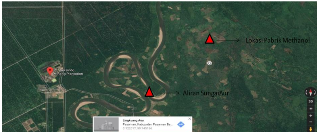
Gambar 1.3 Lokasi pabrik di Pasaman Barat

Analisa SWOT ( Strenght, Weakness, Opportunities, Dan Threat ) kecamatan pasaman barat pada Tabel 1.4