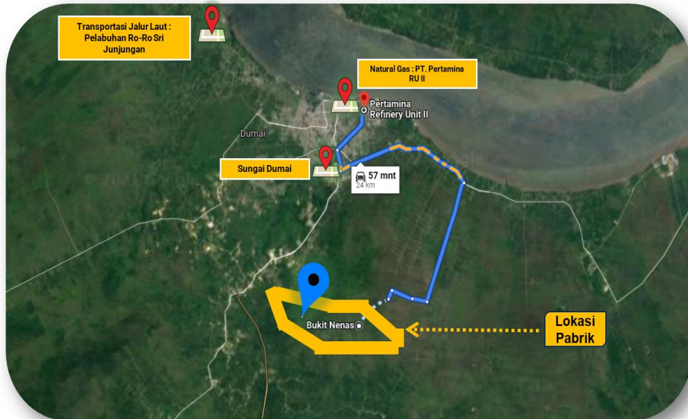
Gambar 1.2 Bukit Nenas, Bukit Kapur, Kota Dumai, Riau

Lokasi ini terletak di Bukit Nenas, Bukit Kapur, Kota Dumai, Riau, yang dapat dilihat pada Gambar 1.2 .