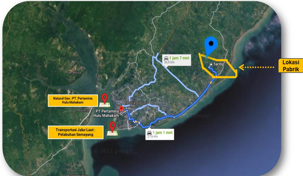
Gambar 1.4 Teritip, Kec. Balikpapan Timur, Kota Balikpapan, Kalimantan Timur

Lokasi ini terletak di Teritip, Kec. Balikpapan Tim, Kota Balikpapan, Kalimantan Timur dapat dilihat pada Gambar 1.4 .