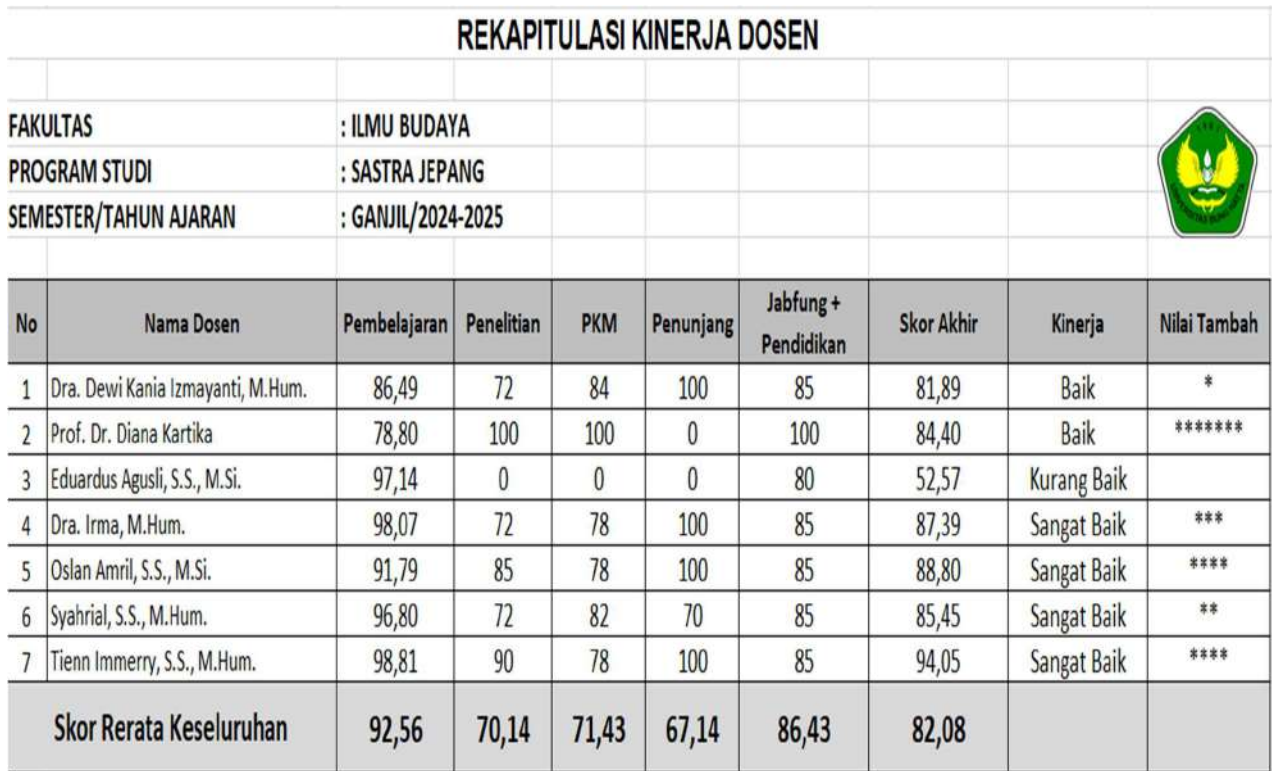
Tabel 2. Rekapitulasi Mutu Kinerja Dosen Tetap Prodi Sastra Jepang 2024-1

Dari tabel rekapitulasi kinerja tujuh orang dosen tetap prodi Sastra Jepang dapat disimpulkan rerata skor akhir 82,18 artinya mencapai kinerja BAIK. Rincian kinerja sebagai berikut.