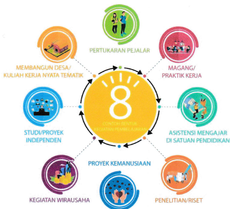
Gambar 1. Bentuk Kegiatan Pembelajaran MB-KM

Semua kegiatan MB-KM harus dilaksanakan dengan bimbingan dari dosen. Kampus merdeka diharapkan dapat memberikan pengalaman kontekstual lapangan yang akan meningkatkan kompetensi mahasiswa secara utuh, siap kerja, atau menciptakan lapangan kerja baru. Universitas Bung Hatta adalah perguruan tinggi yang menginspirasi, mencerdaskan, memotivasi, memedulikan, dan memberdayakan. Di samping itu, juga menerapkan nilai-nilai Ke-bunghatta-an seperti jujur, santun, dan disiplin. Dengan nilai-nilai tersebut, diharapkan terjadi akselerasi transformasi Universitas Bung Hatta dari berbasis pembelajaran menjadi berbasis wirausaha pada tahun 2045. Diharapkan dapat memberikan kontribusi dalam pembangunan bangsa yang tercermin dalam delapan Indikator Kinerja Utama (IKU) yang ditetapkan pada Keputusan Menteri Pendidikan dan Kebudayaan Nomor 754/P/2020. Oleh karena itu, dalam rangka merespon tantangan global dan perubahan kebijakan pemerintah, Universitas Bung Hatta secara adaptif terus berinovasi dengan menetapkan arah pengembangan untuk bertransformasi menjadi perguruan tinggi pendidikan berwawasan entrepreneurship.