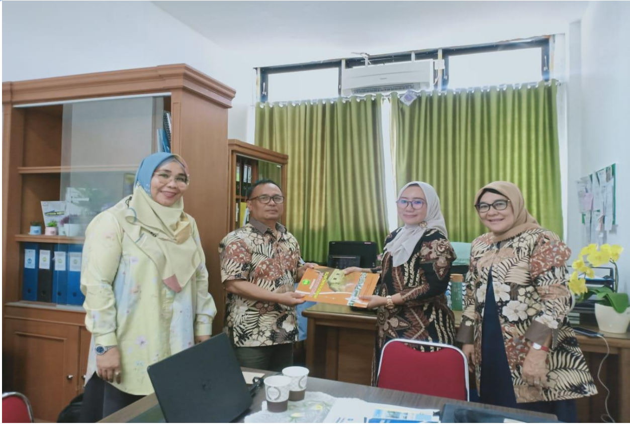
Foto Kegiatan Audit