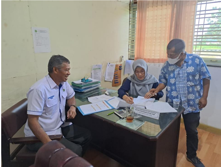
Foto Kegiatan Audit