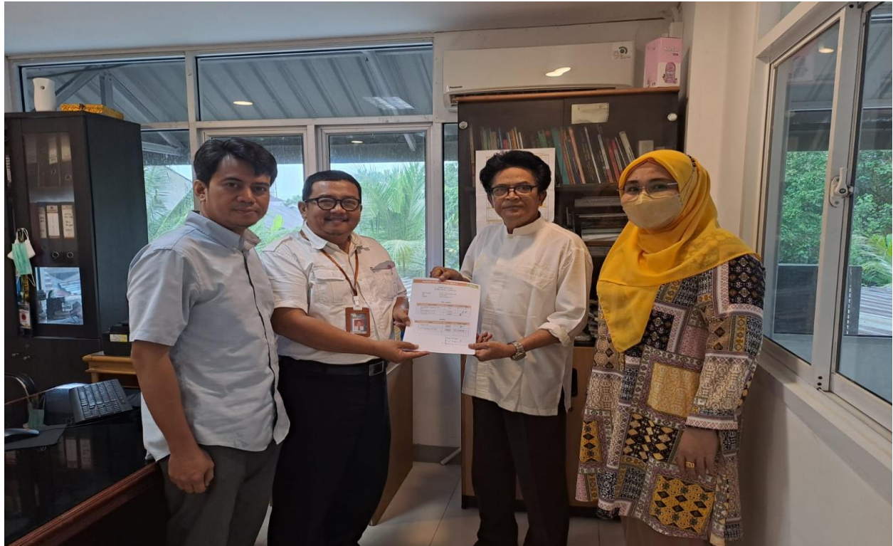
Foto Kegiatan Audit